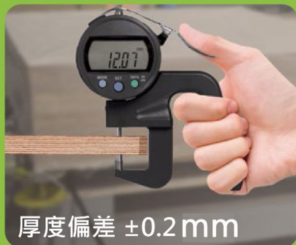
厚度偏差 \pm 0.2 mm